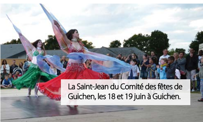
La Saint-Jean du Comité des fêtes de Guichen, les 18 et 19 juin à Guichen.