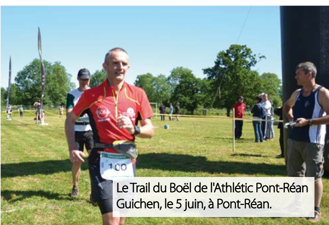
Le Trail du Boël de l'Athlétic Pont-Réan Guichen, le 5 juin, à Pont-Réan.