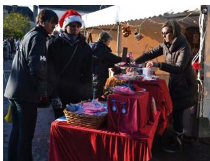
Le marché de Noël de la Commune les 10 et 11 décembre, sous les Halles et dans le centre bourg.