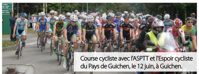
Course cycliste avec l'ASPTT et l'Espoir cycliste du Pays de Guichen, le 12 juin, à Guichen.