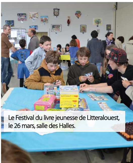
Le Festival du livre jeunesse de Litteralouest, le 26 mars, salle des Halles.