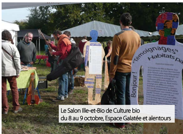
Le Salon Ile-et-Bio de Culture bio du 8 au 9 octobre, Espace Galatée et alentours