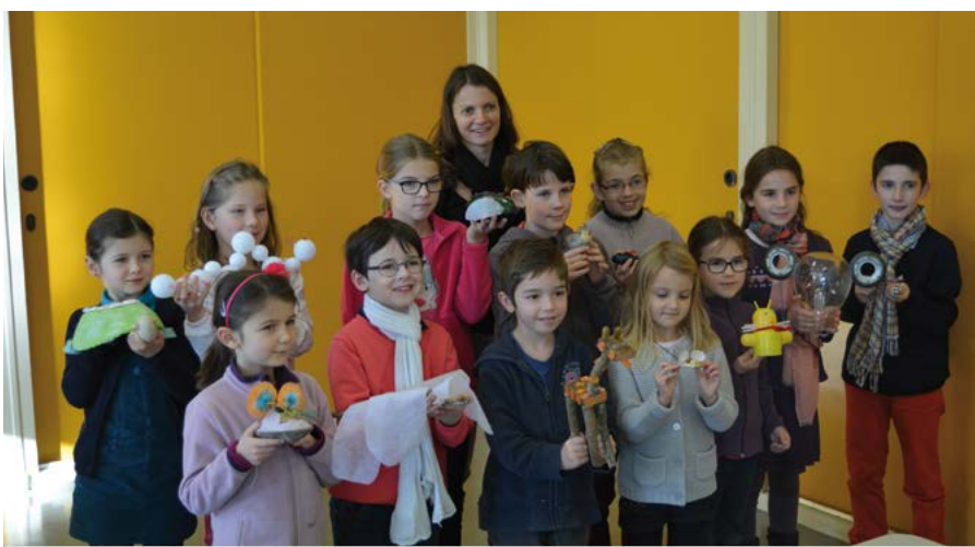
Les P'tits rats d'arts de Guichen ont été sélectionnés parmi les 200 participants au concours "Bestioles by me" des ateliers Art terre (de Cesson Sévigné). L'idée était de créer une bestiole réaliste ou imaginaire à partir de matériaux récupération.