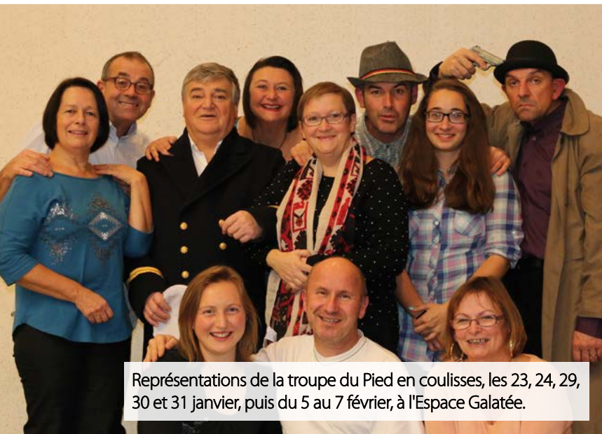
Représentations de la troupe du Pied en coulisses, les 23, 24, 29, 30 et 31 janvier, puis du 5 au 7 février, à l'Espace Galatée.