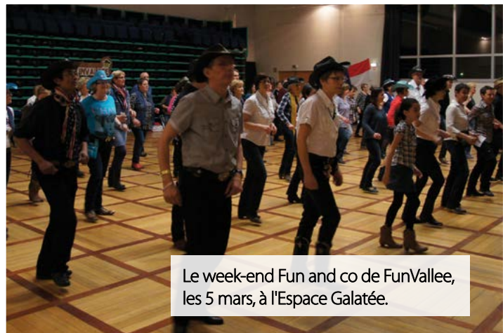
Le week-end Fun and co de FunVallee, les 5 mars, à l'Espace Galatée.