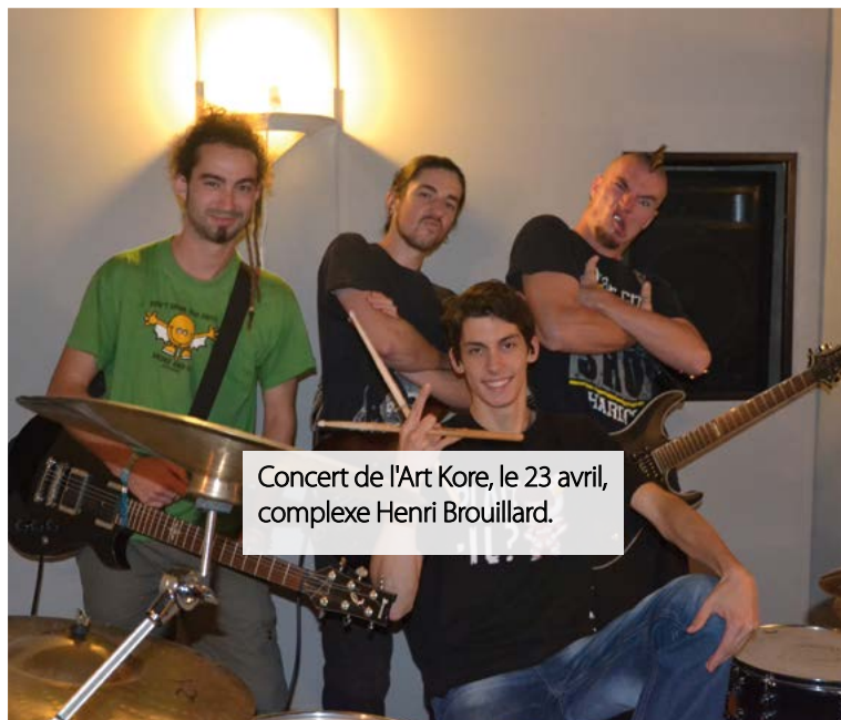
Concert de l'Art Kore, le 23 avril, complexe Henri Brouillard.