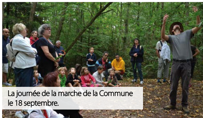
La journée de la marche de la Commune le 18 septembre.