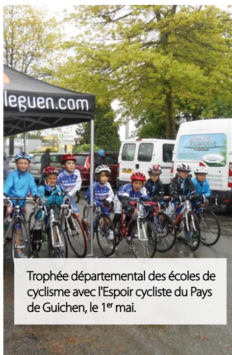
Trophée départemental des écoles de cyclisme avec l'Espoir cycliste du Pays de Guichen, le 1 er mai.