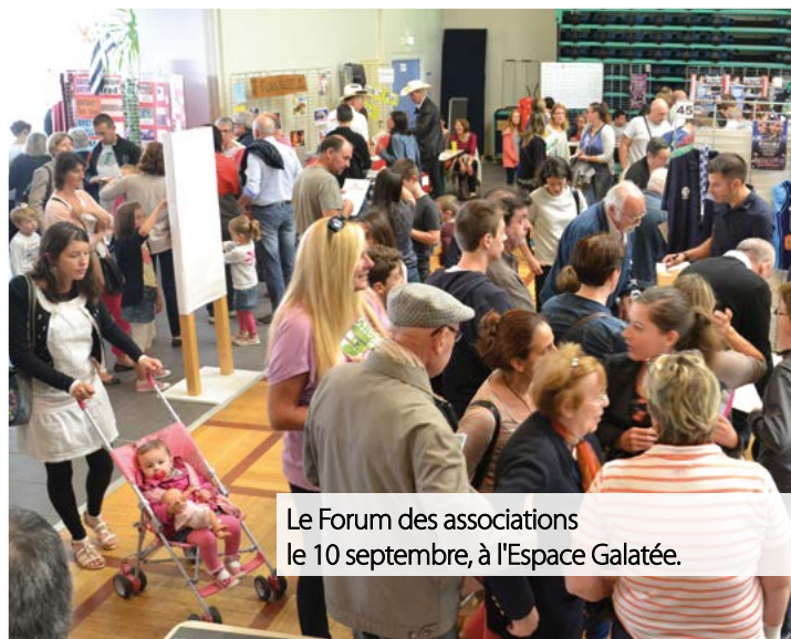
Le Forum des associations le 10 septembre, à l'Espace Galatée.