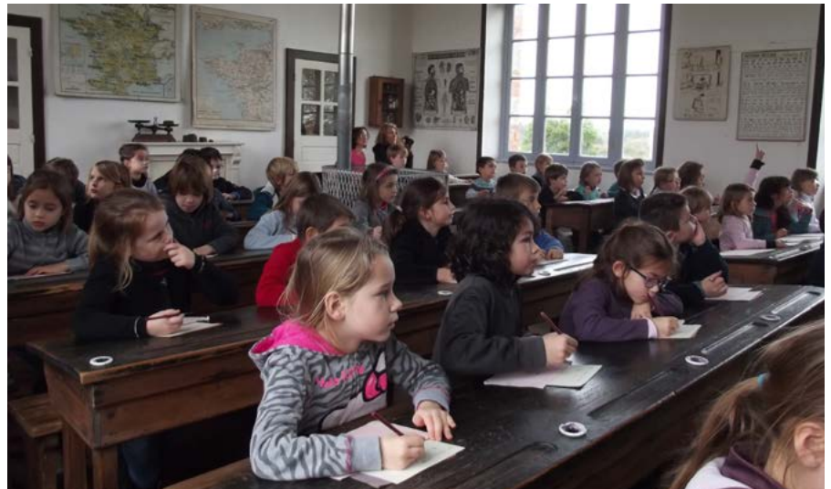
Une journée à l'école d'autrefois, à Bothoa : ça ne rigole pas !