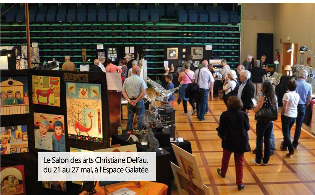
Le Salon des arts Christiane Delfau, du 21 au 27 mai, à l'Espace Galatée.