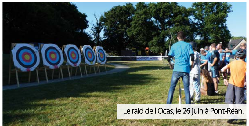
Le raid de l'Ocas, le 26 juin à Pont-Réan.