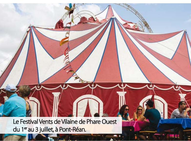
Le Festival Vents de Vilaine de Phare Ouest du 1 er au 3 juillet, à Pont-Réan.