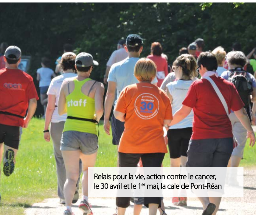
Relais pour la vie, action contre le cancer, le 30 avril et le 1 er mai, la cale de Pont-Réan