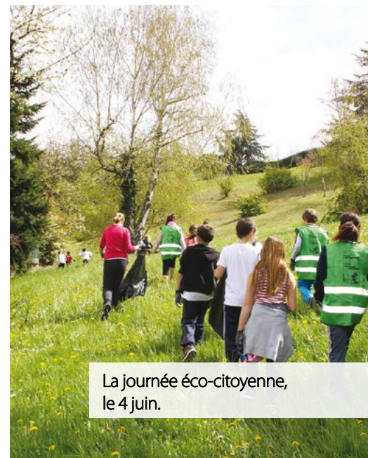
La journée éco-citoyenne, le 4 juin.