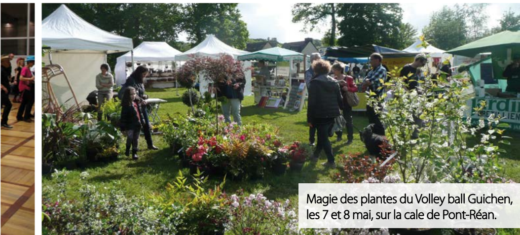
Magie des plantes du Volley ball Guichen, les 7 et 8 mai, sur la cale de Pont-Réan.