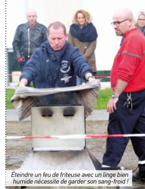
Éteindre un feu de friteuse avec un linge bien humide nécessite de garder son sang-froid !

Actuellement, l'ensemble du territoire français est placé au 2 e niveau du plan Vigipirate : "sécurité renforcée risque attentat". Dans ce cadre, plusieurs mesures de vigilance, de prévention et de protection sont à appliquer, c'est le cas du contrôle visuel des sacs.