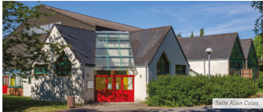
Salle Alain Colas.

2 phases de travaux sont prévues. La première, de mai à septembre 2020, concerne la réfection de la toiture. Le coût de ce projet est évalué à