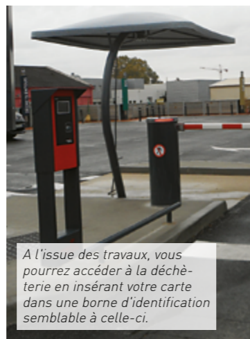
A l'issue des travaux, vous pourrez accéder à la déchèterie en insérant votre carte dans une borne d'identification semblable à celle-ci.

Pendant ces 5 mois, les usagers, particuliers et professionnels, sont invités à déposer leurs déchets dans les déchèteries les plus proches (Val d'Anast ou Gui-