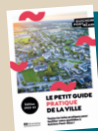
tableau complet sera intégré dans le Reflet d'octobre/novembre. Il sera à détacher pour remplacer celui des pages 10 et 11 de votre guide.

Dans le Guide 2022-23 distribué avec le Reflet d'août/septembre, les pages sur les professionnels de santé sont incomplètes. Un nouveau