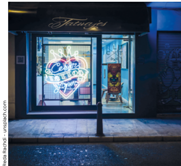
Reda Rachdi - unsplash.com