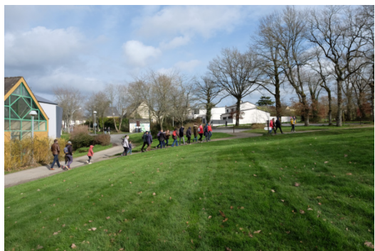
Photos de la traversée de Guichen réalisée avec les habitants en lien avec l'action bande passante