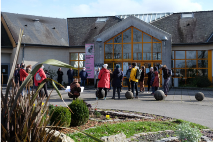
Photos de la traversée de Guichen réalisée avec les habitants en lien avec l'action Galatée 2.0