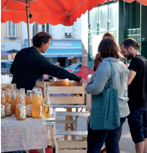
Photos prises durant le marché du jeudi hors les murs