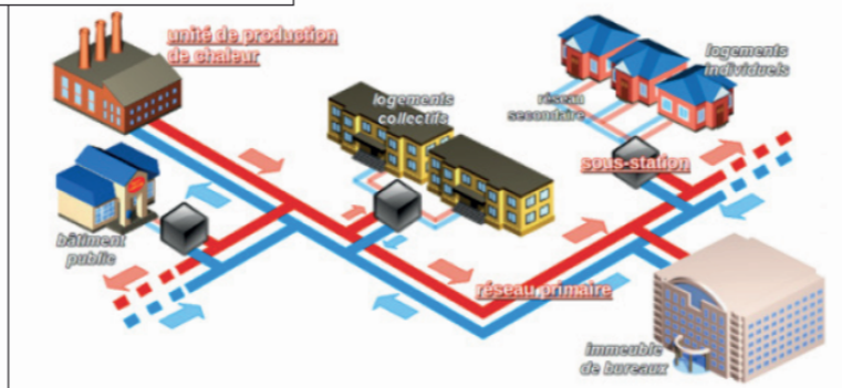
SCHÉMA RÉSEAU DE CHALEUR

Les procès-verbaux sont consultables en Mairie ou sur le site internet.