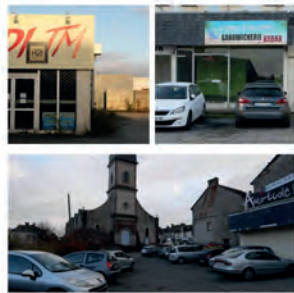
Extrait des scénarios projetés des places de Guichen

imperméabilisation : 100% végétalisation : 0%