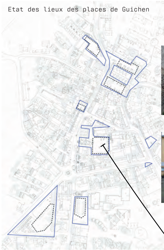
DES PLACES PRINCIPALEMENT OCCUPEES PAR DU STATIONNEMENT